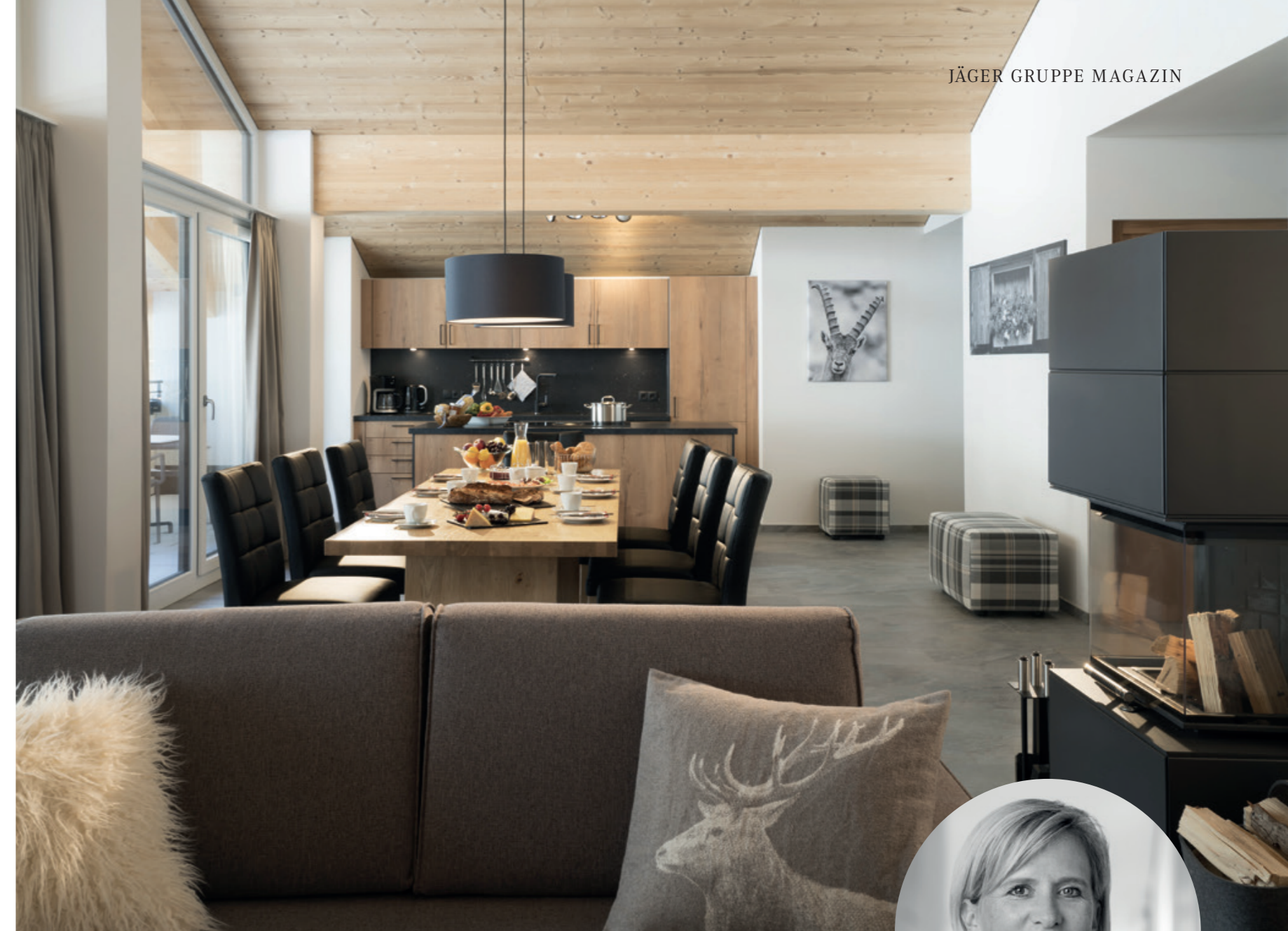
APPARTEMENT ADLERHORST - ARLBERGRESORT KLÖSTERLE

Die Jäger Immobilien GmbH hält und betreibt alle nicht betriebsnotwendigen Immobilien der Jäger Gruppe. Dazu gehören zahlreiche Wohn- und Gewerbeimmobilien sowie Hotelresorts an den Standorten Kühtai und Klösterle mit ca. 450 Betten, die unter dem Brand AlpinLodges betrieben werden.