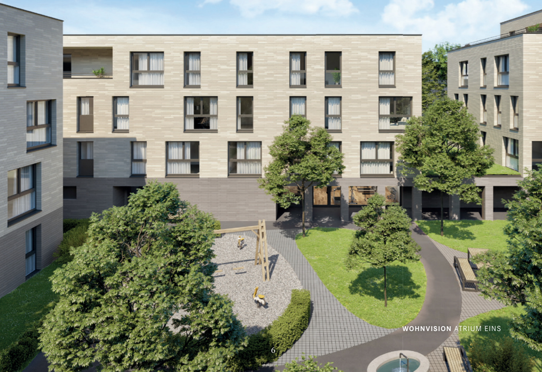
WOHNVISION ATRIUM EINS

VON DER FREUDE ZUKUNFTSWEISENDE IDEEN AUF DEN WEG ZU BRINGEN