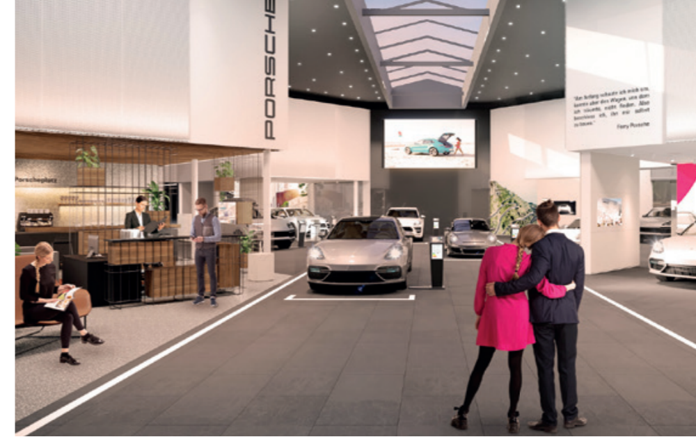
PORSCHE-, SEAT- ZENTRUM RANKWEIL

„So sattelfest wie wir uns heute präsentieren, stehen wir da, weil wir ein hervorragendes Team haben. Bei uns funktioniert das Miteinander und die gegenseitige Unterstützung.“